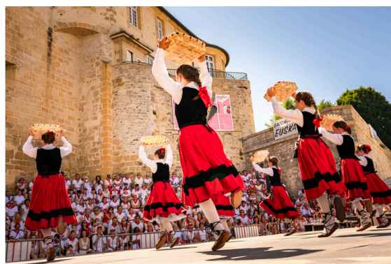
Fêtes de Bayonne du 15 au 19 juillet 2026

Cinq jours et cinq nuits en blanc et rouge ! Convivialité et plaisir d'être ensemble rythmeront ce grand temps fort de Bayonne. Programme à venir.