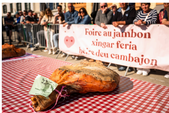
Foire au Jambon de Bayonne du 23 au 26 avril 2026

La Foire au Jambon de Bayonne est le plus ancien événement de la ville , puisque sa première édition remonte à l'an 1462 !